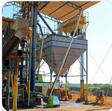
TAMICES DE CLASIFICACIÓN