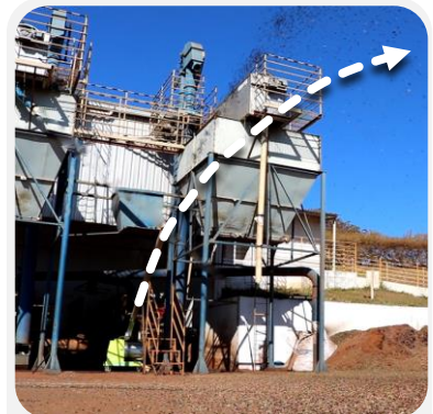
VUELO LIBRE (clasifica por densidad)*

*El lanzamiento en vuelo libre a un patio separa el café e impurezas por su densidad: densos se depositan más distante, livianos más cerca.