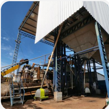
TOLVAS Y SILOS ELEVADOS