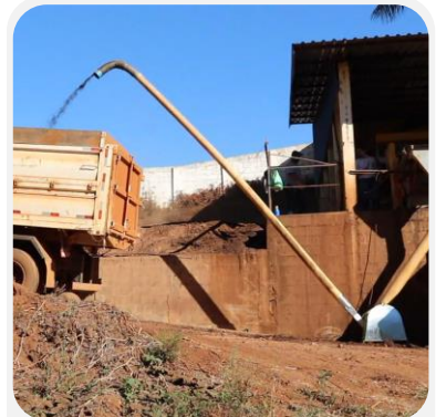
CAMIONES Y VOLQUETES