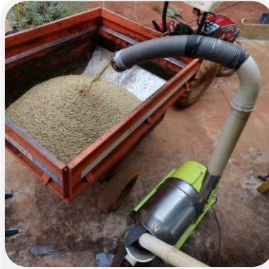
CARRETAS DE TRACTOR