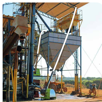
TAMICES DE CLASIFICACIÓN