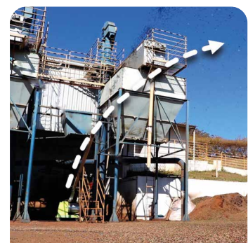
VUELO LIBRE (clasifica por densidad)*

*El lanzamiento en vuelo libre a un patio separa el café e impurezas por su densidad: densos se depositan más distante, livianos más cerca.