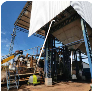
TOLVA Y SILO ELEVADOS